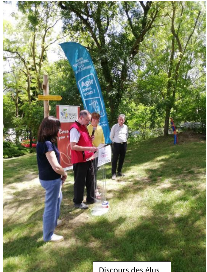
Discours des élus