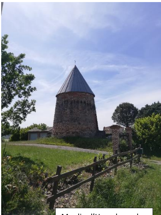
Moulin d'Hercule sur le chemin du Pistouillé