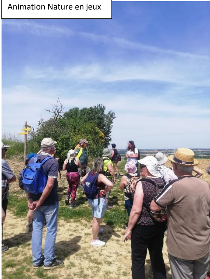
Animation Nature en jeux