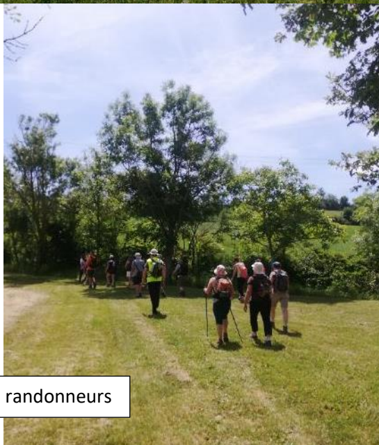
Le groupe de randonneurs