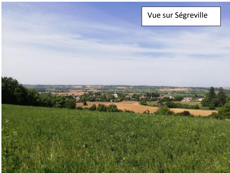
Vue sur Ségreville